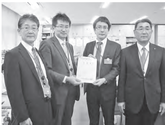
水管理・国土保全局 廣瀬河川計画課長