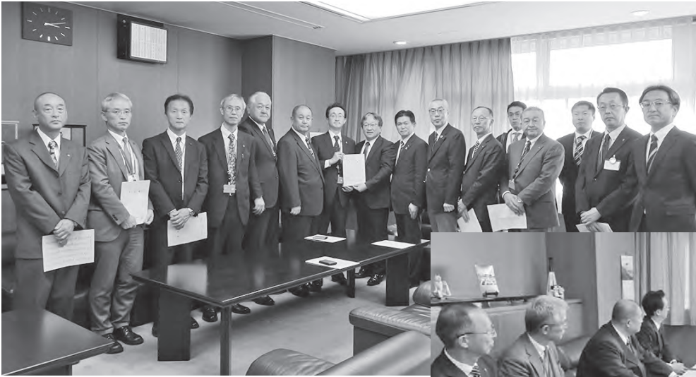
国土交通省 森事務次官