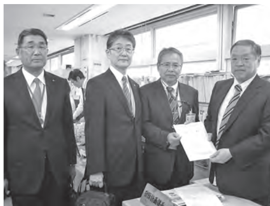
今井砂防計画課長