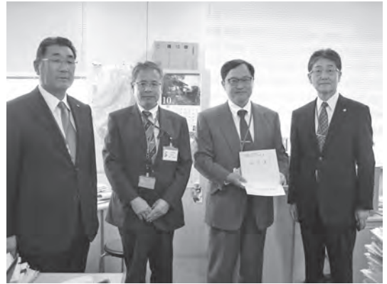
国土政策局 荒川地方振興課長