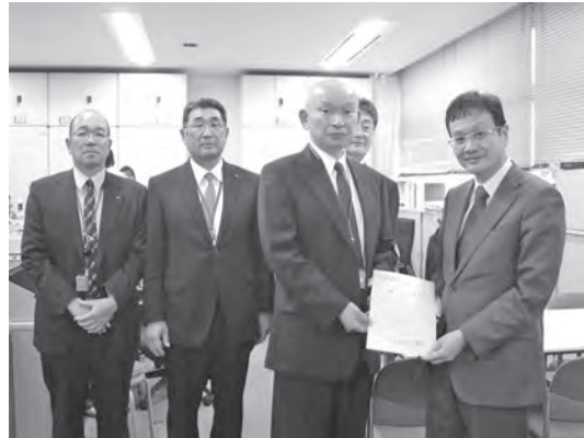
道路局 東川国道・技術課長