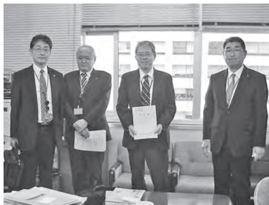
都市局 本田街路交通施設課長