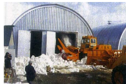
エコスノードームへの給雪作業